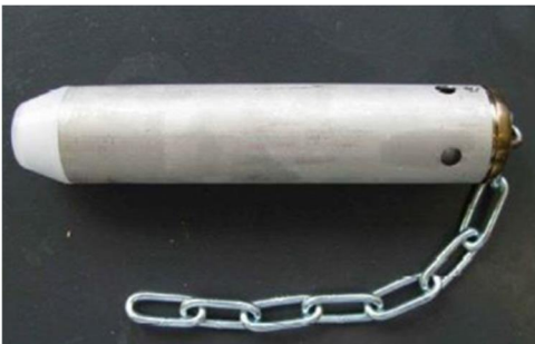
写真2 無線式 pH センサー

このことから、今後はpHセンサーにより、環境変化が深部体温に与える影響についても検討が可能であると考えています。