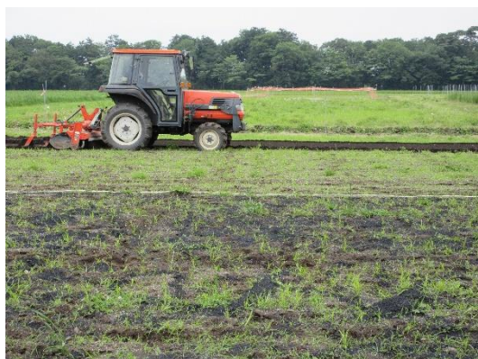
バイオ炭をまいた後の様子

5月下旬に播種したトウモロコシは、現在順調に生育中です。今後は、バイオ炭をまいたことによる生育や収量への影響について調査を進めて参ります。（草地飼料研究室）